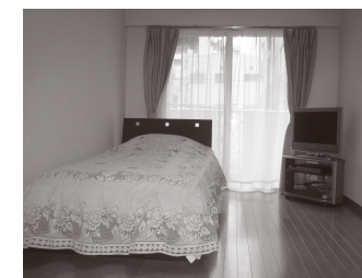
収納付き セミダブルベッド 布団セット(入居時新品) ベッドカバー