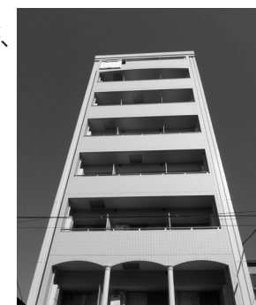
プチグランデ上野 外観