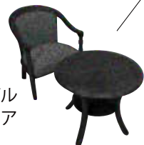
ミニテーブル アームチェア