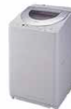
乾燥機能付き 全自動洗濯機