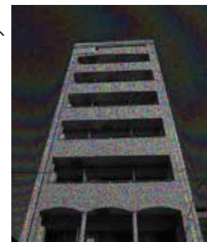
プチグランデ上野 外観