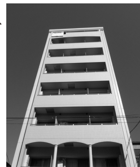
プチグランデ上野 外観