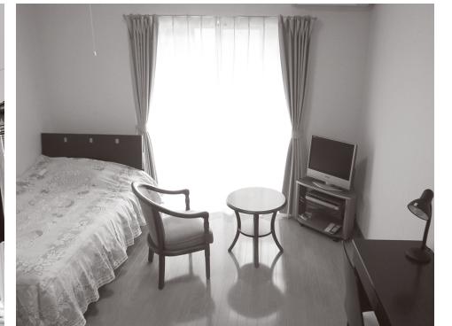
プチグランデピア 室内

※図面と現況が異なる場合は現況を優先とします。 ※写真の製品とは異なる場合があります。 ※インターネット・有料チャンネルのご利用には、別途各会社との契約が必要です。 ※個人契約の際は家賃保証会社のご契約が必要となります。