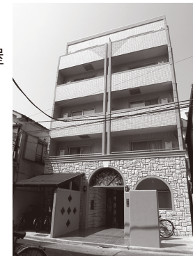
プチグランデピア 外観

敷金 / 1ヵ月 礼金 / 1ヵ月 契約期間 / 2年間 更新料 / 新賃料の1ヵ月 住宅総合保険 / 17,000円 (2年更新/当社指定)