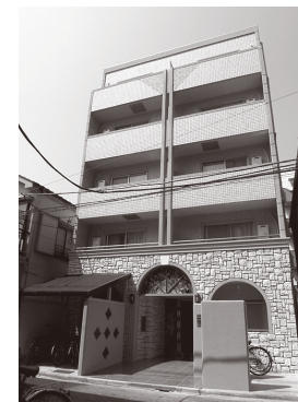
プチグランデピア 外観

敷金 / 1ヵ月 礼金 / 1ヵ月 契約期間 / 2年間 更新料 / 新賃料の1ヵ月 住宅総合保険 / 17,000円 (2年更新/当社指定)