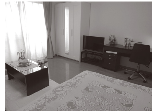
プチグランデピア 室内

※図面と現況が異なる場合は現況を優先とします。 ※写真の製品とは異なる場合があります。 ※インターネット・有料チャンネルのご利用には、別途各会社との契約が必要です。 ※個人契約の際は家賃保証会社のご契約が必要となります。