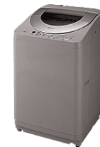
乾燥機能付き 全自動洗濯機