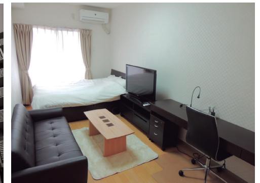
プチグランデミレーヌ 室内