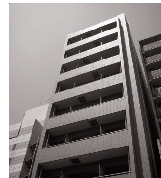
プチグランデミレーヌ 外観

駅周辺には、24時間営業のスーパーやコンビニだけでなく、ショッピング施設・飲食店が多数あり、生活に便利です。