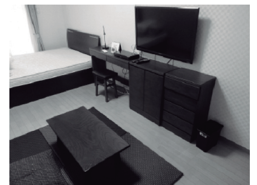
プチグランデミレーヌ室内イメージ